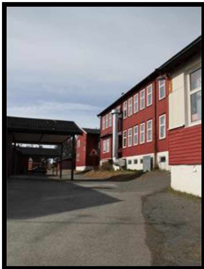
Bergseng Skole Bergslia 15, 9403 Harstad Tlf: 770 27 840