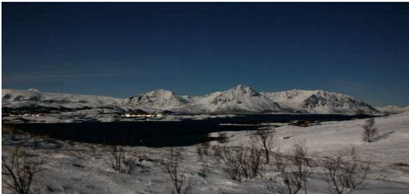
Nattstemning – Krøttøy mot Leirvåg og Grytøy