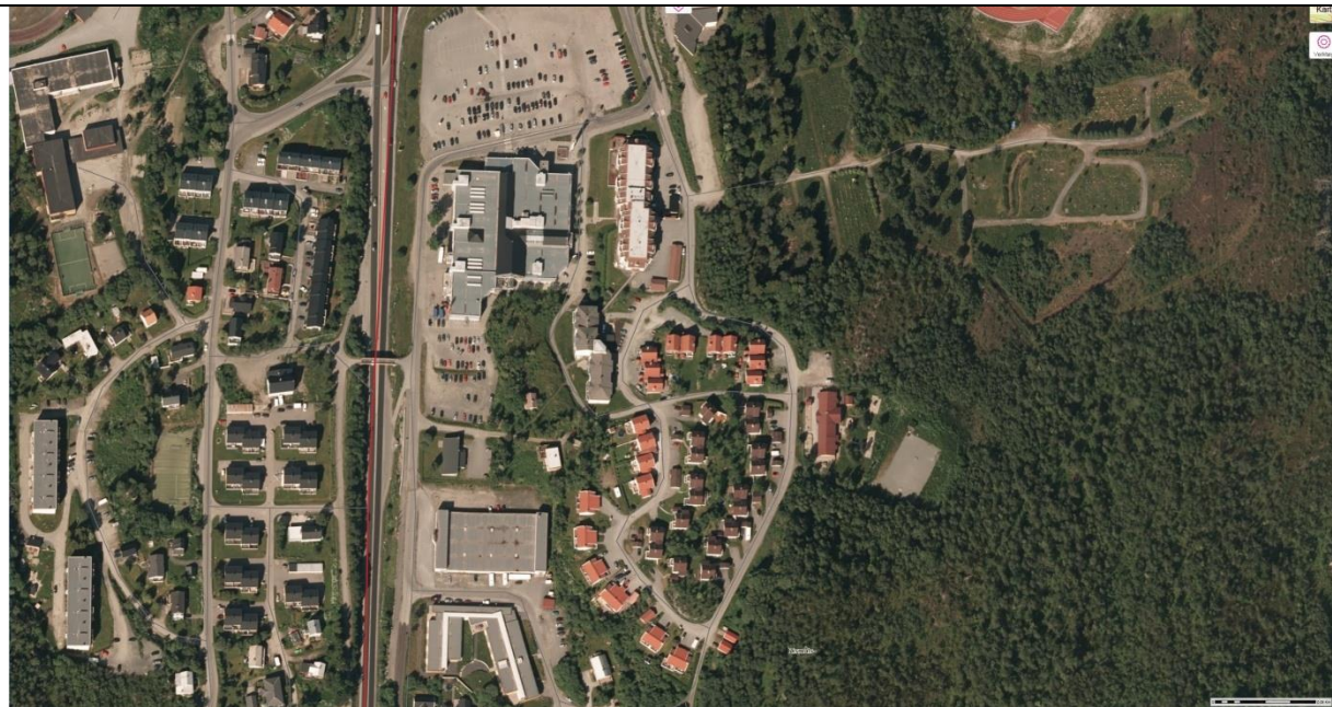
Illustrasjon av grønnstrukturen i området

Viktige tiltak vil være å opprettholde vegetasjonssoner i planområdet. Det bør etterstrebes å legge føringer for utforming på bygget som er tilpasset situasjonen og eksisterende bebyggelse.