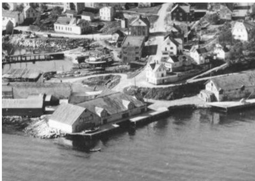
Figur 2: Foto av kullageret sett fra nordøst. Bildet er tatt i 1956.