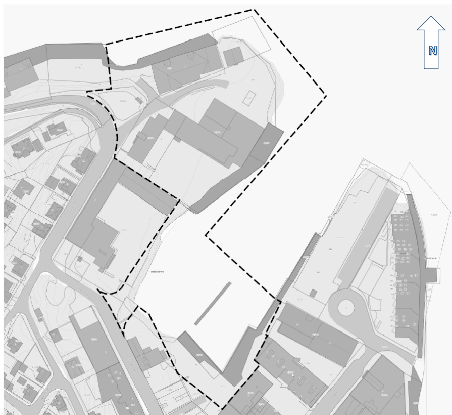
Figur 1: Planavgrensing Holstneset, Harstad.

Området har vært benyttet til industri- og næringsformål siden ca. 1919, og store deler av området er utfyllt i sjø. Nordvest for Holstneset har det vært drevet skipsverft i en årrekke.